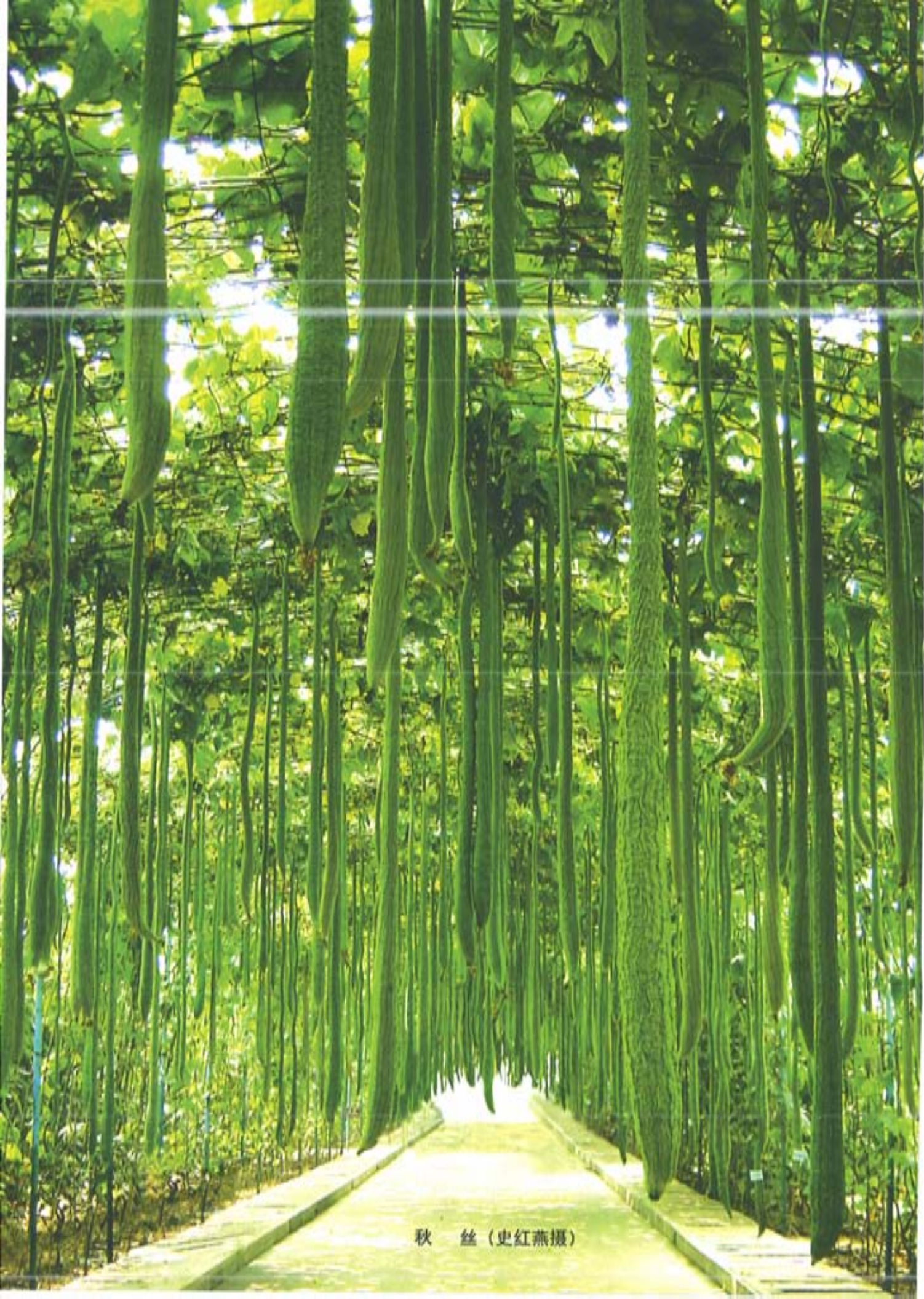
秋 丝