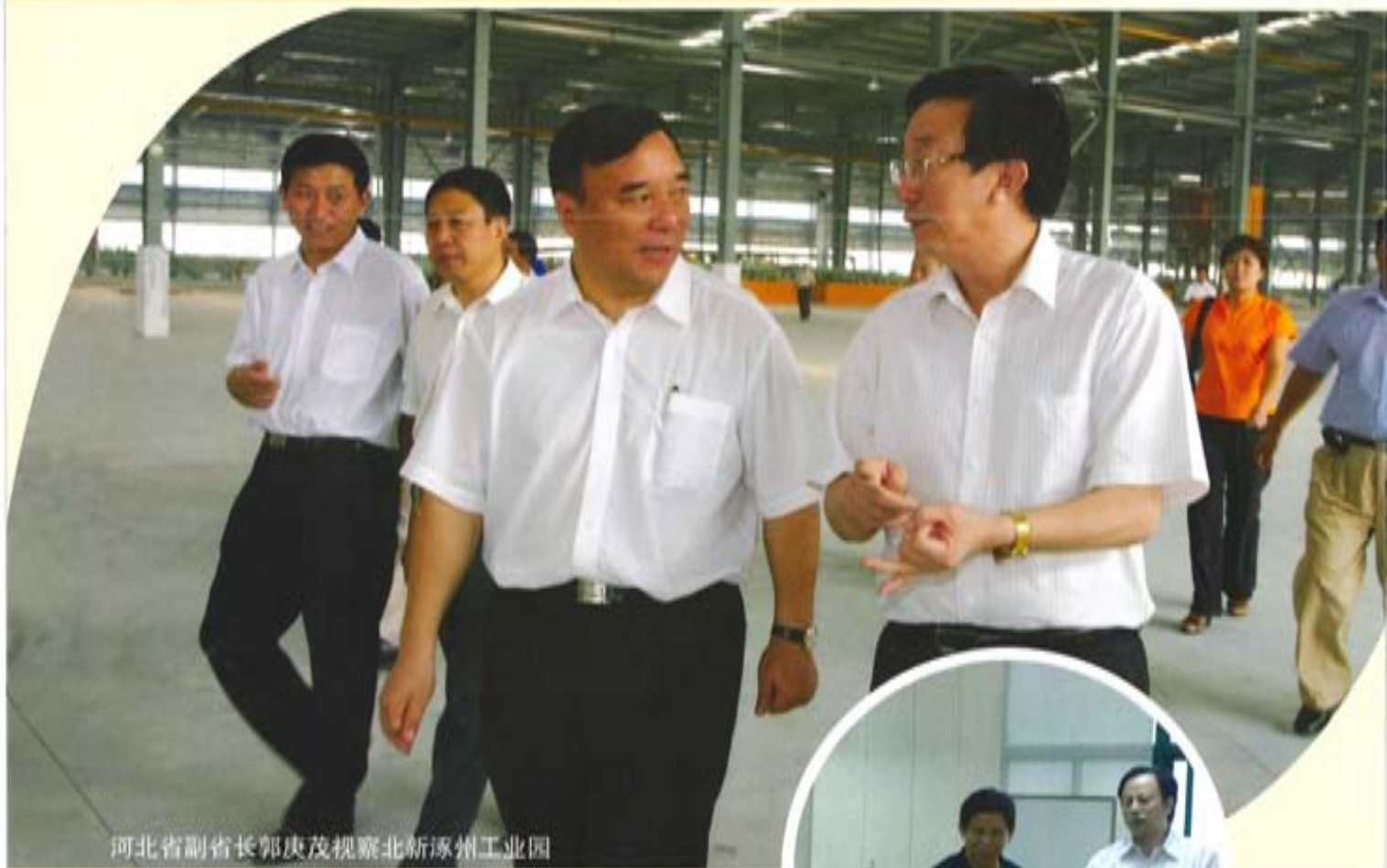
河北省副省长郭庚茂视察北新涿州工业园