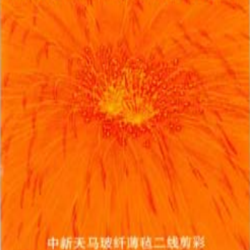
中新天马玻纤薄毡二线剪彩